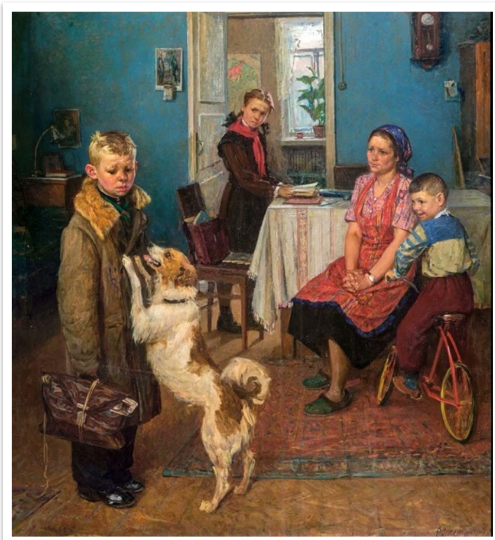
Ф.П.Решетников «Опять двойка» 1952 ГГ