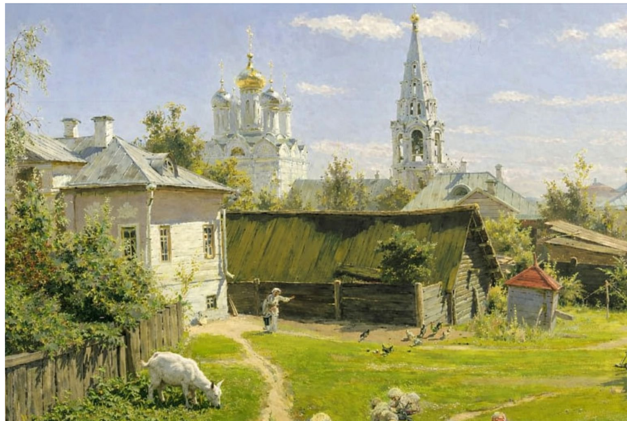
Василий Дмитриевич Поленов «Московский дворик», 1878 Холст, масло. ГТГ