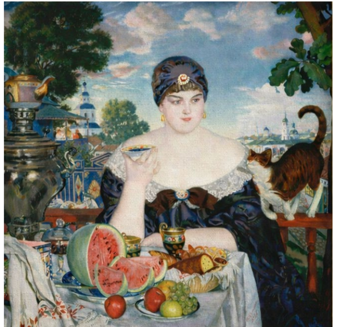
Б.М. Кустодиев. Купчиха за чаем. 1918 Холст, масло.