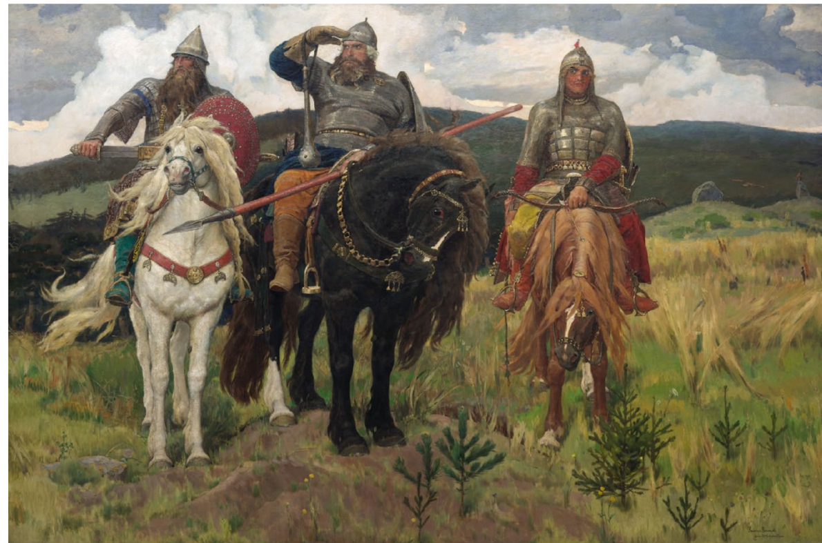
Виктор Михайлович Васнецов «Богатыри» 1898 Холст, масло. ГТГ